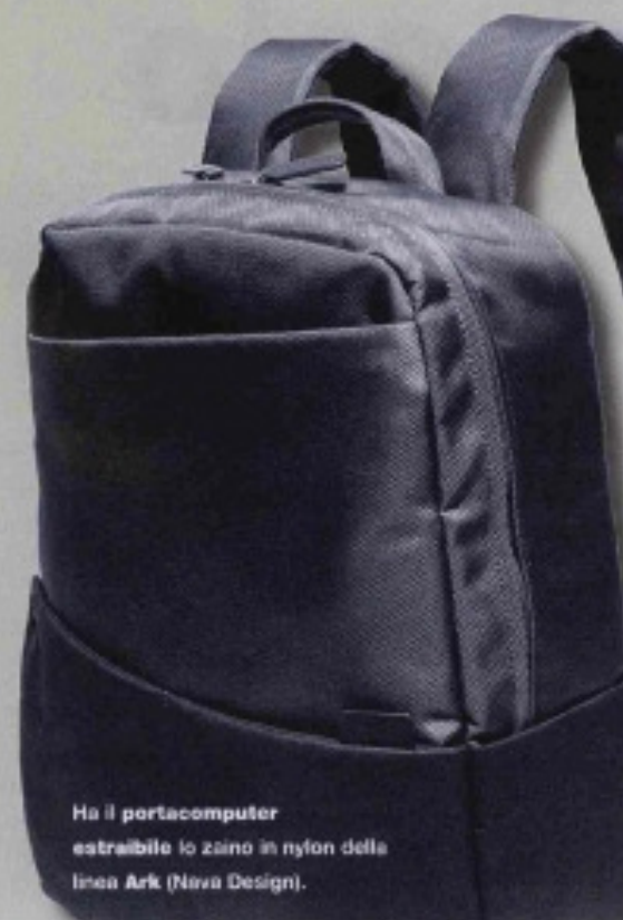
Ha il portacomputer estraibile lo zaino in nylon della linea Ark (Nova Design).