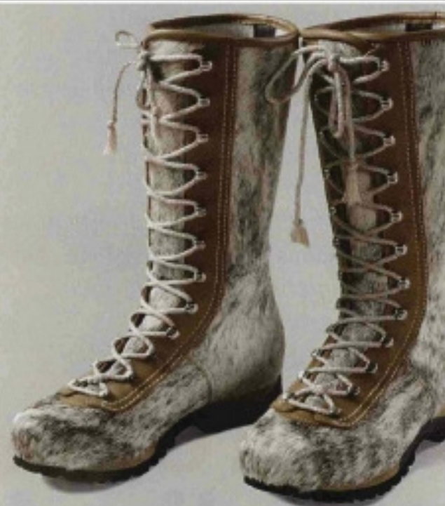
Modello e materiali ricordano quelli indossati per la spedizione sul K2 nel 1954. Sono i Karakorum 2 Boot Cow in cavallino, con fodera isolante in Thinsulate e suola antiscivolo Vibram (Tecnica).

che per la stagione propone un cappottino in lana di pecora prodotta in Valgrisenche. Un omaggio a Henriette d'Angeville, prima donna a scalare nel 1838 il Monte Bianco proprio con un cappotto. "Se nell'Ottocento questa lana diventava naturalmente impermeabile dopo una serie di bagni in acqua gelida di torrente, oggi è cosa in aiuto la scienza" racconta l'a.d. Alessandra Fulginiti. Il processo messo a punto si chiama bionic finish ed è una nanotecnologia che prende spunto dalla pelle dello squalo per rico-